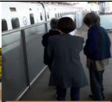
新幹線を見てみたい！