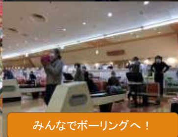
みんなでボーリングへ！