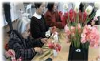
花屋さんの切り花