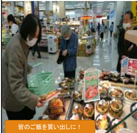
皆のご飯を買い出しに！