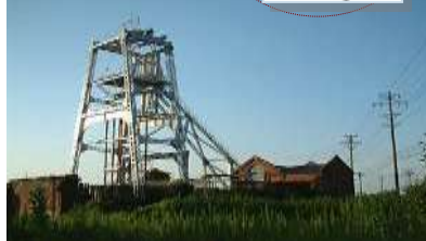
宮原坑(世界文化遺産)