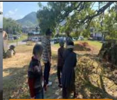
天気がいいから散歩へ