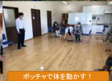
ポッチャで体を動かす！