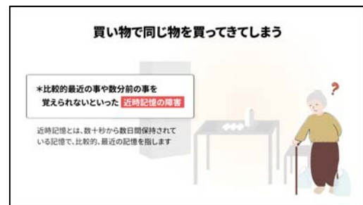
図1 eラーニング教材画面例